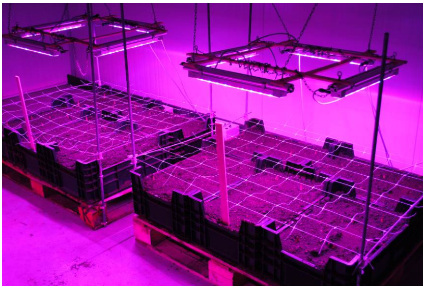
Foto 2. Fase 2 onder LED belichting