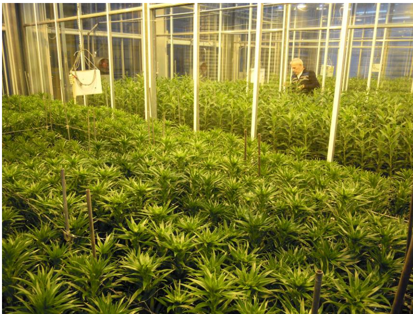
Foto 1. Overzicht kasafdelingen

Er was wel een lichte trend zichtbaar van een effect van de lichtintensiteit in de laatste fase; 6000 lux in de laatste fase gaf, in vergelijking met 3000 lux vaak een langer vaasleven en minder knopval tijdens het vaasleven.